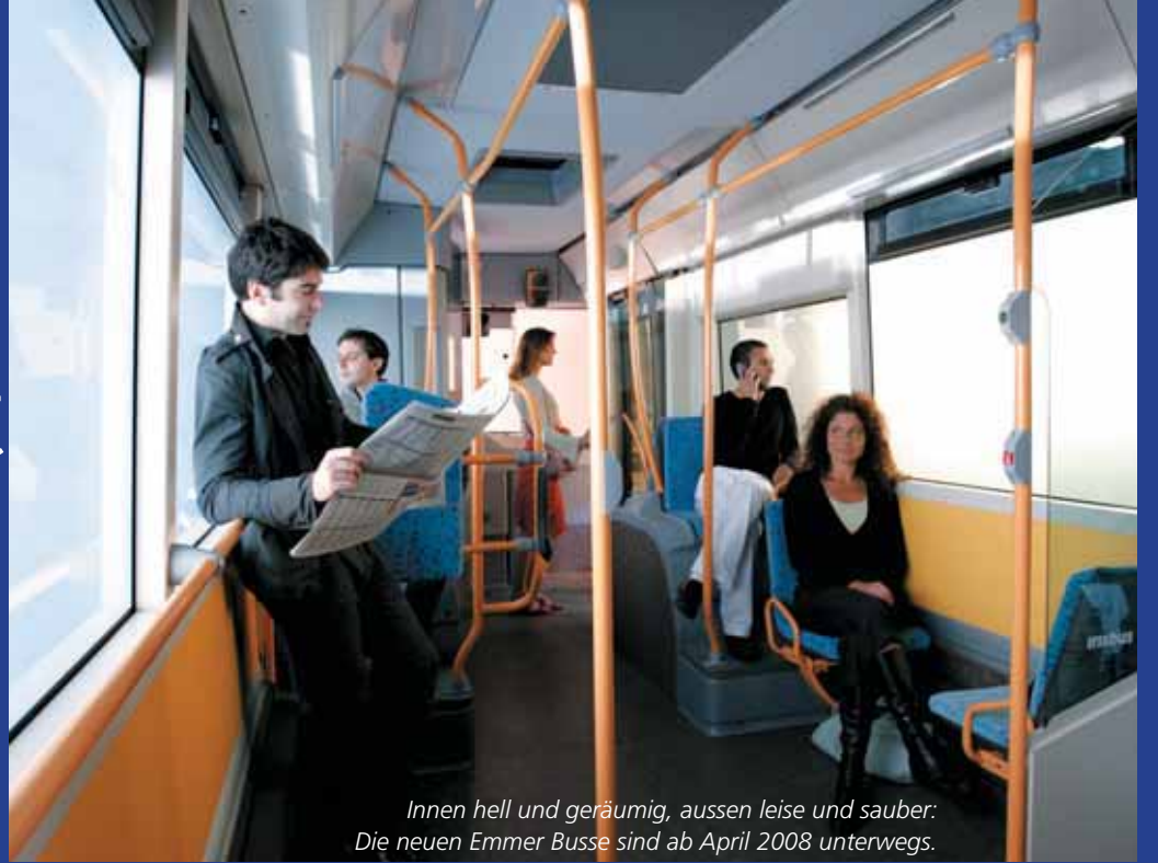
Innen hell und geräumig, aussen leise und sauber: Die neuen Emmer Busse sind ab April 2008 unterwegs.

Im April 2008 nimmt die Auto AG Rothenburg neun neue Fahrzeuge auf dem Streckennetz der Emmer Busse in Betrieb. Modernste Technologie bringt Fahrgäste, Umwelt und Emmer Bevölkerung weiter.